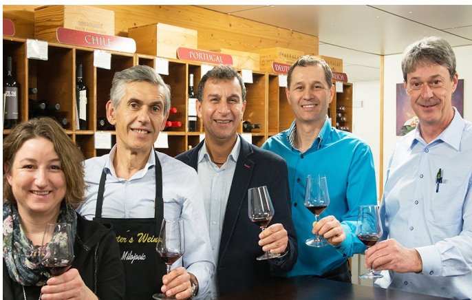
Das St. Peters Weine-Team stösst auf 20 erfolgreiche Jahre an.

Die Kundschaft schätzt die sympathische Atmosphäre und weiss, dass St. Peter's Weine die jeweiligen Vorlieben genau kennt. Man trifft sich immer wieder gerne zu Degustationsanlässen um die offerierten Plättli zu neuen oder altbewährten Lieblingsweinen zu geniessen.